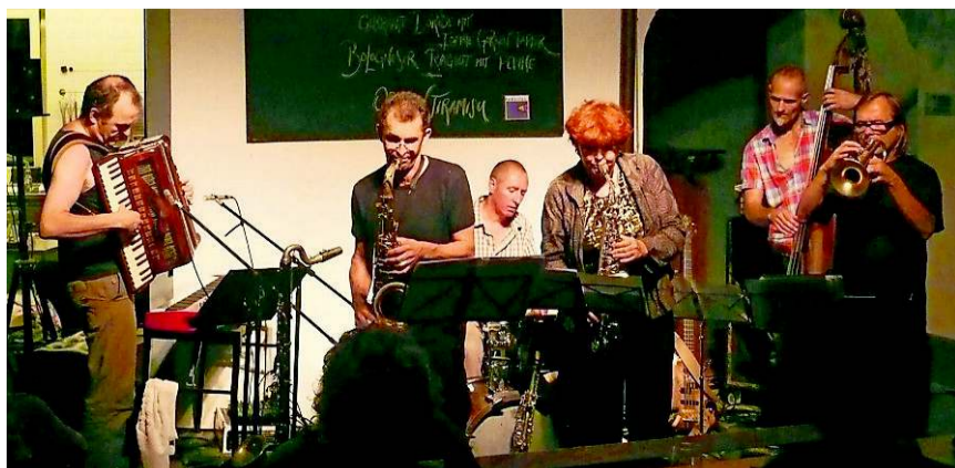
Die Federlosband spielt in der Mittagsmusik im Gleis 1.