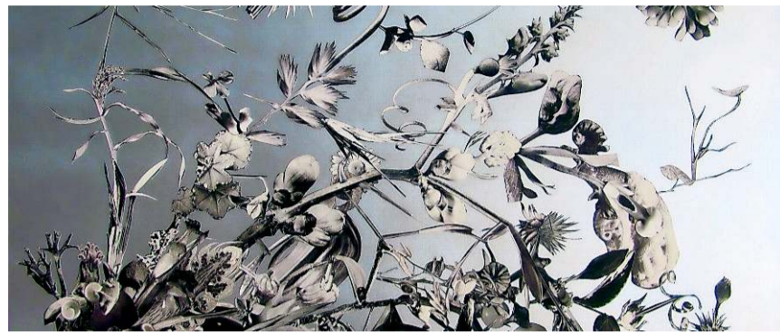
huber.huber zeigen bearbeitete Pflanzencollagen (Ausschnitt). HO