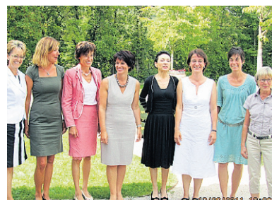
Bundesrätin Leuthard (4.v. l.)

DIE GEMEINDEBIBLIOTHEK bleibt am Freitag, 19. August, geschlossen (Personalausflug).