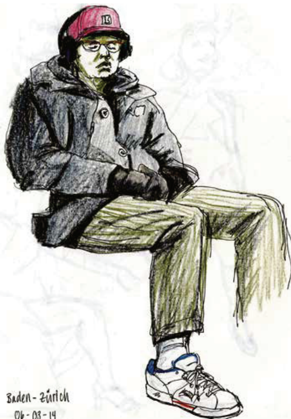
Baden - Zürich 06-08-14

WETTINGEN Galerie im Gluri Suter Huus 26. August bis 2. Dezember